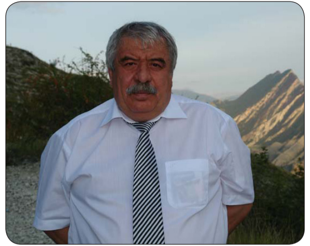
Мы предлагаем читателям стихи Магомеда Ахмедова, которые перевёл на русский язык Юрий Щербаков.

Магомед Ахмедович – ученик и продолжатель традиций великого Расула Гамзатова, который славил дружбу народов и Страну Советов. Стихи Ахмедова гражданственны и порою остро социальны.