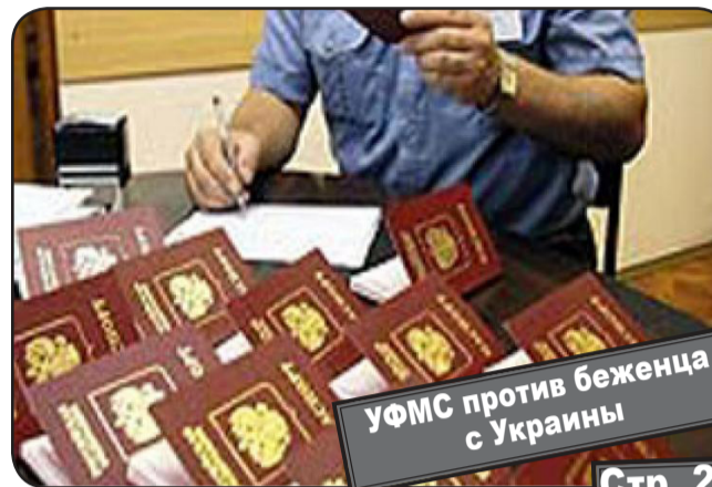
УФМС против беженца с Украины