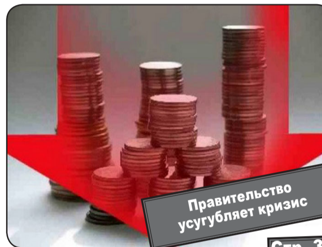
Правительство усугубляет кризис