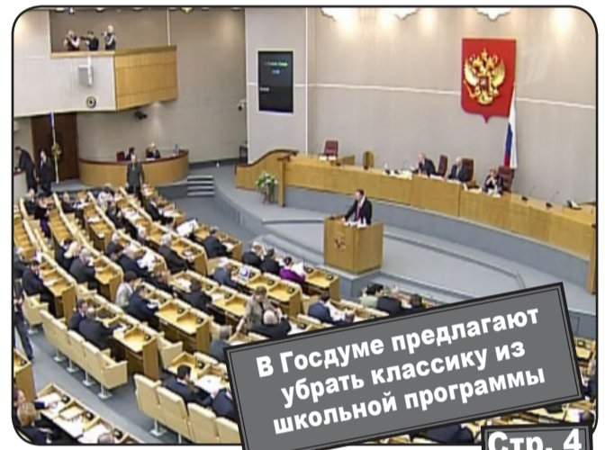
В Госдуме предлагают убрать классику из школьной программы Стр. 4