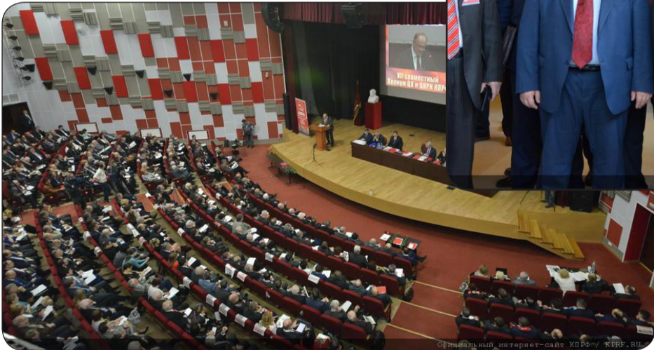
Официальный интернет-сайт КПРФ / KPRF.RU

стоянии. Над этим вопросом мы будем работать ближайшие три года. От того, насколько грамотно и профессионально справимся с этой задачей, зависит судьба не только нашей партии, но и судьба страны», - считает лидер КПРФ.