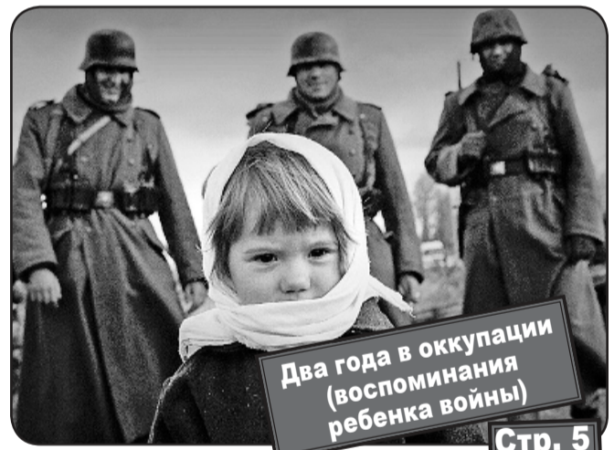
Два года в оккупации (воспоминания ребенка войны) Стр. 5