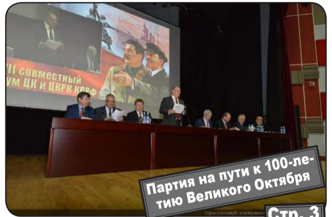
Партия на пути к 100-летию Великого Октября Стр. 3