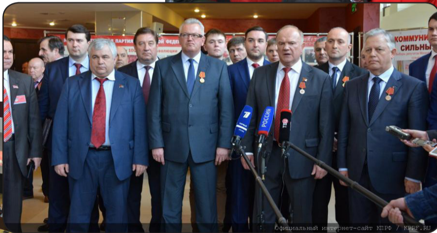
Официальный интернет-сайт КПРФ / KPRF.RU