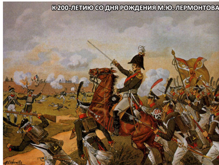
К 200-ЛЕТИЮ СО ДНЯ РОЖДЕНИЯ М.Ю. ЛЕРМОНТОВА

Поэт задумывается над сменной эпох, вызывающей прилив и отлив народного воодушевления. Куда делось «могучее, лихое племя»? Появилась тема «судьбы». Перенесение земной сущности на божество и олицетворение ее в «господней воле» отражает усиление в народном сознании элемента фатализма, что характерно для периода общественного упадка. Здесь поэт уловил значитель-