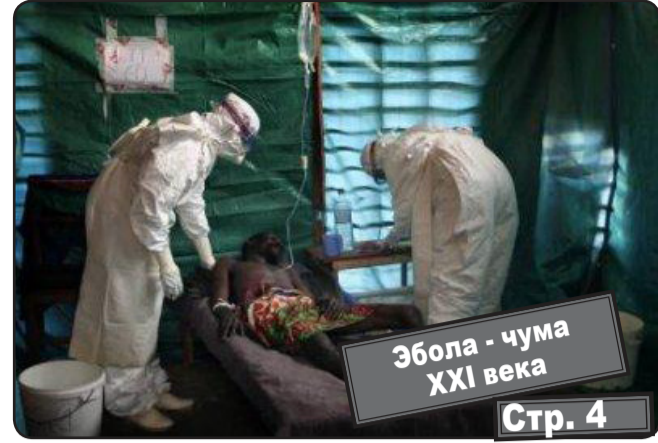
Эбола - чума XXI века Стр. 4

www.kprfast.ru официальный сайт коммунистов Астраханской области