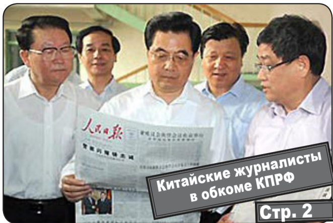
Китайские журналисты в обкоме КПРФ Стр. 2