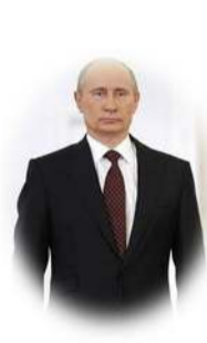
В. В. Путин укрепляет государство капиталистов (прежде всего олигархов)