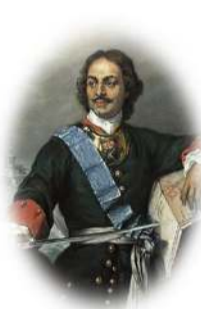
Пётр I укреплял государство помещиков и купцов