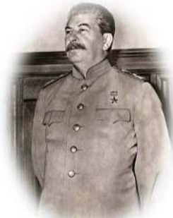
И. В. Сталин укреплял государство рабочих и крестьян