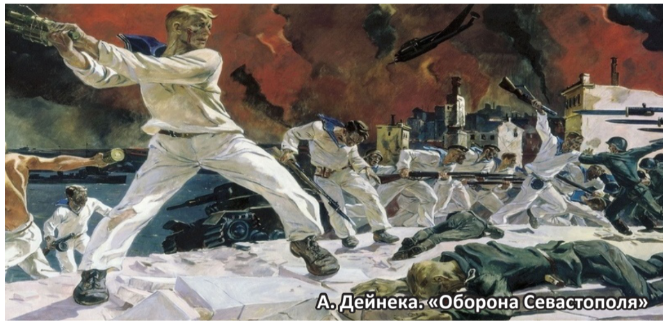
А. Дейнека. «Оборона Севастополя»

Годы Великой Отечественной войны ознаменовались взлётом поэзии. Она быстрее и эмоциональнее откликалась на события каждого военного дня. Замечательные поэты-песенники в содружестве с композиторами создали такие песни, которые и сейчас любимы нашим народом. Это «Огонёк», «В прифронтовом лесу», «Ой, туманы мои» Исаковского, «Смуглянка» Шведова, «Дороги» Ошанина и многие другие.