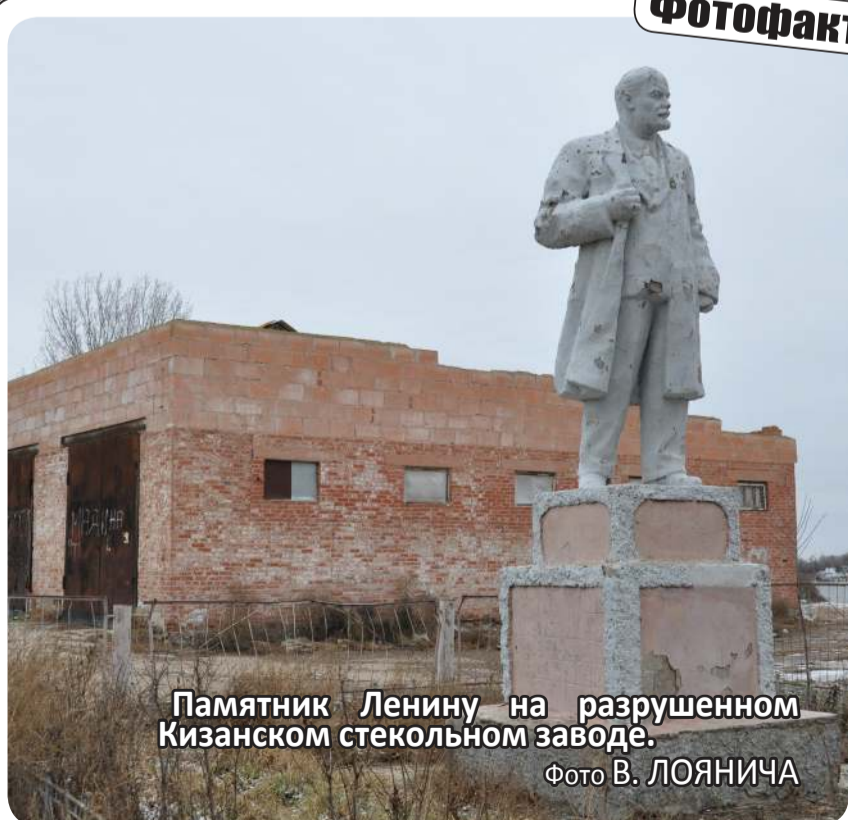
Памятник Ленину на разрушенном Кизанском стекольном заводе.