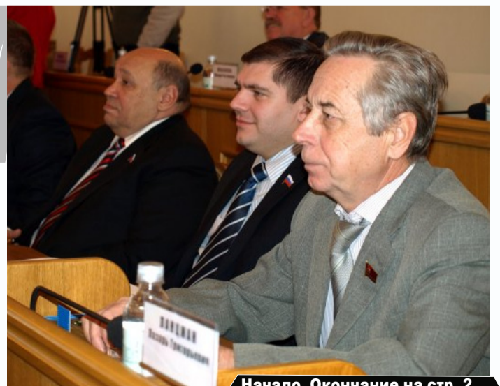
Начало. Окончание на стр. 2

В первом, а затем и во втором чтениях приняты изменения в бюджете области на текущий год. Он увеличен по доходной части на 1,43 млрд. рублей, т.е. на 4,9 % и будет составлять 30,79 млрд. рублей. Соответственно по расходной части он будет равняться 36,138 млрд. рублей, а увеличен почти на 1,675 млрд. рублей. По-прежнему бюджет дефицитный, т.е. расходы превышают доходы на 14,8 %, хотя год назад мы определили дефицит на 13,8 %.