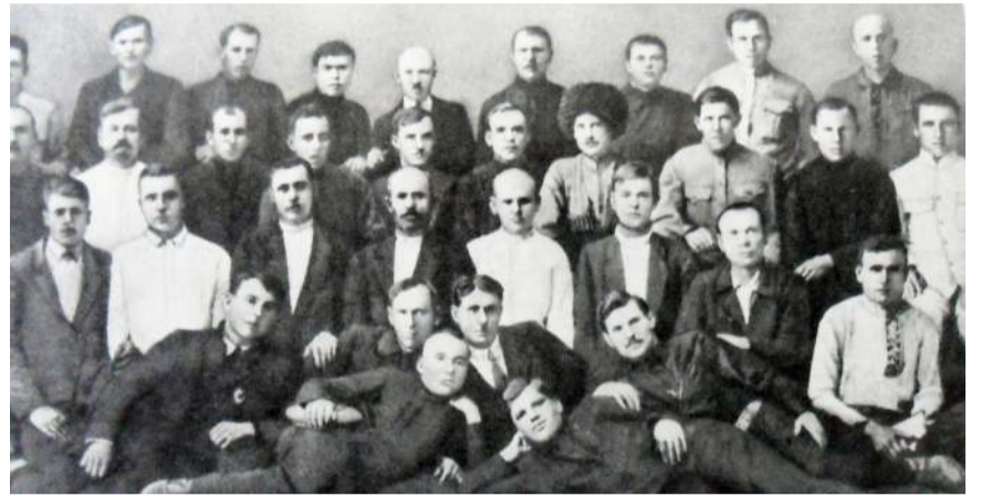
Группа работников Морского экспедиционного отряда. 1919г.

В 1956 году был собран небывалый урожай. Не