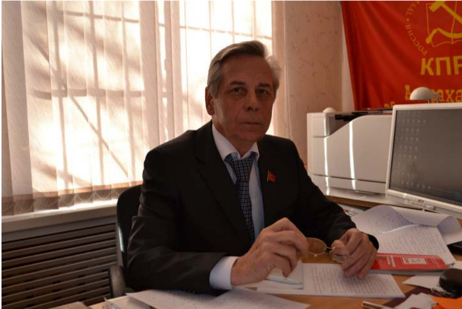
Доклад на IV Пленуме обкома 10 августа 2013г.

Не совсем обычную повестку дня предложило Бюро обкома обсудить на сегодняшнем пленуме. Объясняя, почему. Мы, коммунисты, партийный актив областного отделения хорошо знакомы с цифровыми показателями и общей кризисной ситуацией в России. Узнаем это из докладов на пленумах ЦК, статей и выступлений Г.А. Зюганова и ярко увидели результаты экономического и социального «развития» страны в материалах XV Съезда КПРФ, I Съезда (форума) коммунистов-депутатов, прошедших несколько месяцев назад.