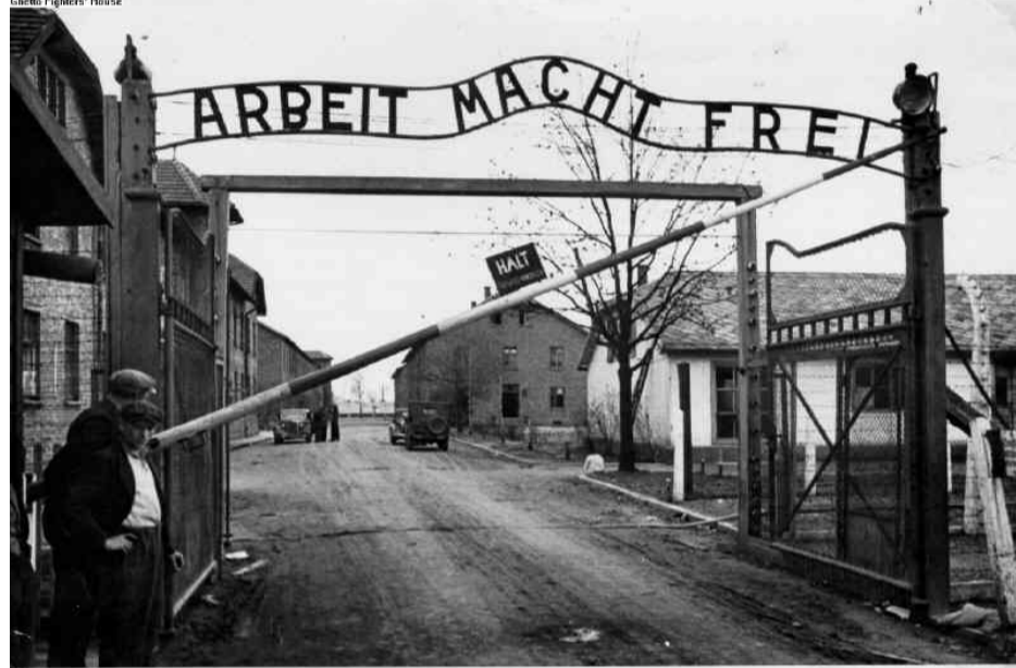
Shelto Fighters' House

постепенно лишало свободы. В конце концов, часть людей, которая оказалась наделена властью и стала обладать собственностью, освободилась от необходимости трудиться. Но потребность в труде осталась. И после этого для большинства людей труд стал каторгой. Каторгой он является и сейчас.