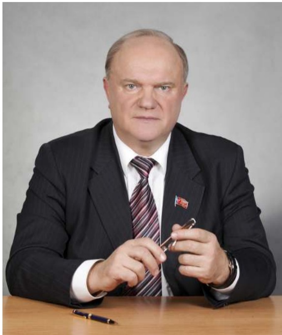
Заявление Президиума ЦК КПРФ

28 июня правительство России спешно внесло в Государственную Думу РФ законопроект, подготовленный с соблюдением строжайшей конспирации. Его название: «О Российской академии наук, реорганизации государственных академий наук и внесении изменений в отдельные законодательные акты». Лишь днём ранее правительство, как карточный шулер, вытащило этот проект из рукава и тут же его одобрило, чтобы внести на рассмотрение парламента. Появление этого документа вызвало шок и негодование у всех думающих людей страны.