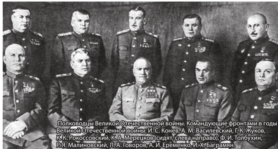
Полководцы Великой Отечественной войны. Командующие фронтами в годы Великой Отечественной войны: И. С. Конев, А. М. Василевский, Г. К. Жуков, К. К. Рокоссовский, К. А. Мерецков (сидят, слева направо), Ф. И. Толбухин, Р. Я. Малиновский, Л. А. Говоров, А. И. Еременко, И. Х. Баграмян.

К сожалению, сегодня далеко не все знакомы с теми высокими оценками, которые дали видные иностранные военные специалисты и Красной Армии в целом, и советским военачальникам, в частности выдающемуся полководцу маршалу Жукову. Некоторые наши соотечественники относятся к Георгию Константиновичу и другим нашим прославленным военачальникам негативно. Однако