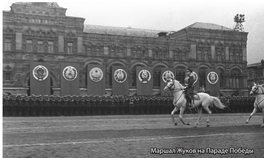
Маршал Жуков на Параде Победы

этой книги можно вычитать много такого, что мы упустили сделать в прошедшие годы. Маршалы и генералы в среднем чрезвычайно молоды, почти ни одного старше 50 лет... Все они — убежденные коммунисты, весьма энергичные люди, и по лицам их видно, что вырезаны они из хорошего народного дерева. В большинстве случаев речь идет о сыновьях рабочих, сапожников, мелких крестьян и т. п. Короче говоря, приходишь к досадному убеждению, что командная верхушка Советского Союза сформирована из класса получше, чем наша собственная. Я рассказал фюреру о просмотренной мной книге генерального штаба о советских маршалах и генералах и добавил: у меня такое