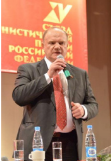
ЗАЯВЛЕНИЕ XV Съезда Коммунистической партии Российской Федерации

Общий кризис капитализма длится уже столетие. Системные противоречия, присущие капитализму, усиливаются на наших глазах. Главным из них остаётся противоречие между общественным характером производства и частной формой присвоения. Ускоряется концентрация капитала в США и других империалистических центрах, которые присваивают львиную долю мирового богатства.