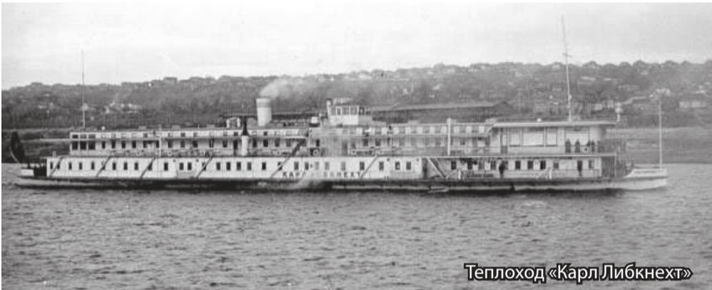
Теплоход «Карл Либкнехт»

Весна 1915 года. У достроечной стенки судостроительной верфи Коломенского завода, в местечке Липня, мирно покачивается очеред-