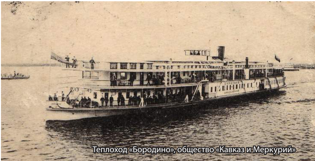
Теплоход «Бородино», общество «Кавказ и Меркурий»

На судах общества стали сжигать в топках паровых котлов нефтяные остатки вместо дров, при постройке пароходов стали устанавливать судовые паровые машины тройного расширения пара, усовершенствовали паровые котлы с целью получения перегретого пара, что привело к увеличению мощности силовой установки и соответственно скорости