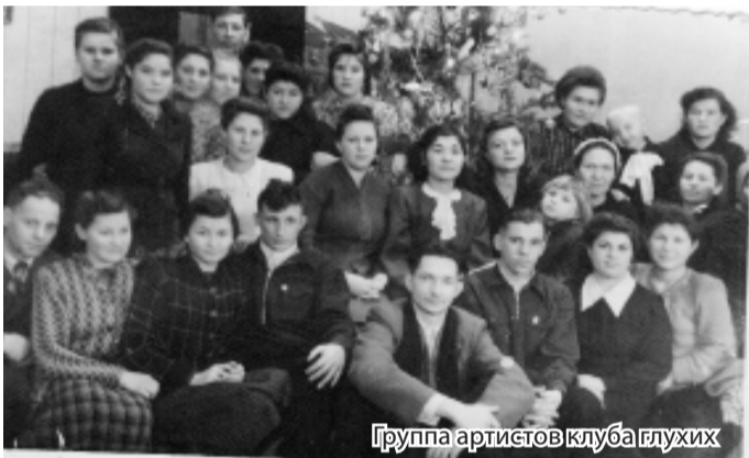
Группа артистов клуба глухих