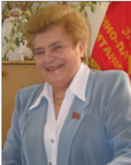
Депутат Госдумы возмущена действиями губернатора Волгоградской области

Депутат Государственной Думы Федерального Собрания Российской Федерации Алевтина Апарина возмущена действиями губернатора Волгоградской области Сергея Боженова по срыву 29 января заседания Волгоградской областной Думы, в ходе которого должны были рассматриваться важнейшие вопросы для населения Волгоградской области, в частности, вопросы здравоохранения и ситуации в жилищно-коммунальном хозяйстве региона, а также отчет двух депутатов федерального парламента от фракций «Единая Россия» и КПРФ.