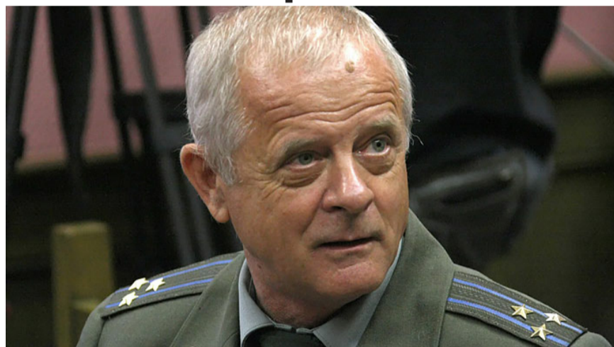
Письмо литераторов в Верховный Суд РФ