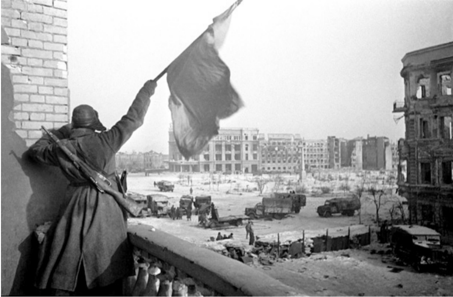
2 февраля 1943 года закончилась Сталинградская битва – событие, ознаменовавшее собой коренной перелом в ходе Второй мировой войны

К концу июня 1942 г. положение на юге советско-германского фронта резко ухудшилось. Разгромив советские войска в Крыму и под Харьковом, гитлеровский «вермахт» полностью взял в свои руки стратегическую инициативу и стремительно продвигался к Волге и на Кавказ. Для успешного продвижения войск на Северный Кавказ и захвата Сталинграда немецкое командование приняло решение разделить группу армий «Юг» на две самостоятельные группы «А» и «Б».