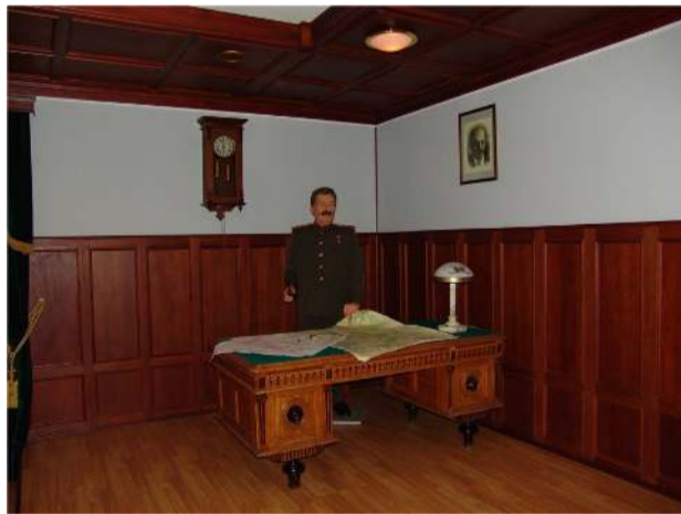
«После моей смерти на мою могилу нанесут много мусора, но ветер истории все развеет...»

21 декабря 2012 года во всем мире будет отмечаться 133-я годовщина со дня рождения великого полководца, генералиссимуса и многолетнего руководителя Советского государства Иосифа Сталина.