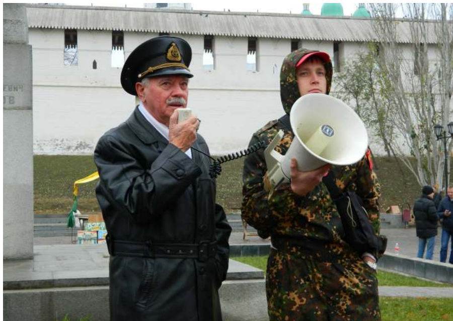
Выступление на митинге 2 декабря

Морское образование в России началось при Петре I, т.е. более 220 лет назад, в Астрахани и Архангельске – там, где имелось самое большое количество парусных судов.