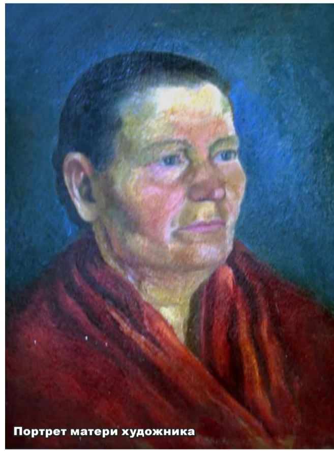
Портрет матери художника