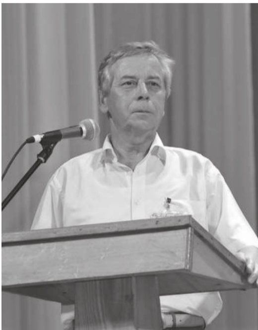
Губернатору Астраханской области А.А. Жилкину. Председателю Думы Астраханской области А.Б. Клыканову.

С 27 сентября сего года, с момента подписания приказа №101 «Росморречфлота» Минтранса РФ о ликвидации Каспийского морского филиала (бывшего Астраханского мореходного училища),