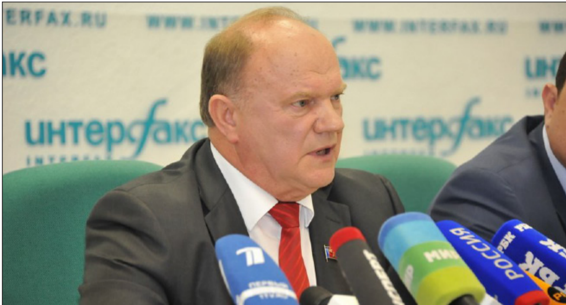
27 августа в ИА «Интерфакс» состоялась пресс-конференция Председателя ЦК КПРФ Г.А. Зюганова. Тема пресс-конференции: «КПРФ на первых губернаторских выборах. Итоги первого этапа кампании. Повестка нового политического сезона».