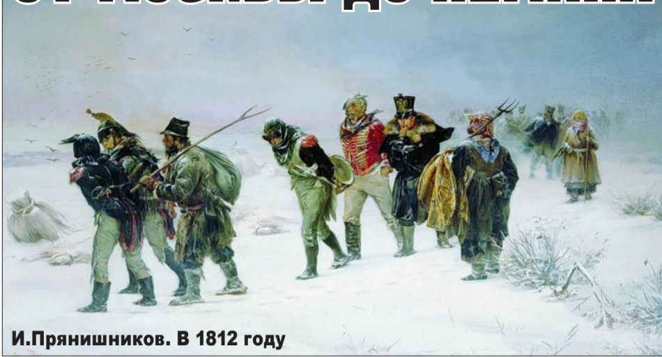
И.Прянишников. В 1812 году

Наполеоновские войска вошли в Москву без боя. В первый же день их появления начались пожары, продолжавшиеся до 18 сентября, опустошившие две трети города. Дымящие пепелища предупреждали: война будет не на жизнь, а на смерть.