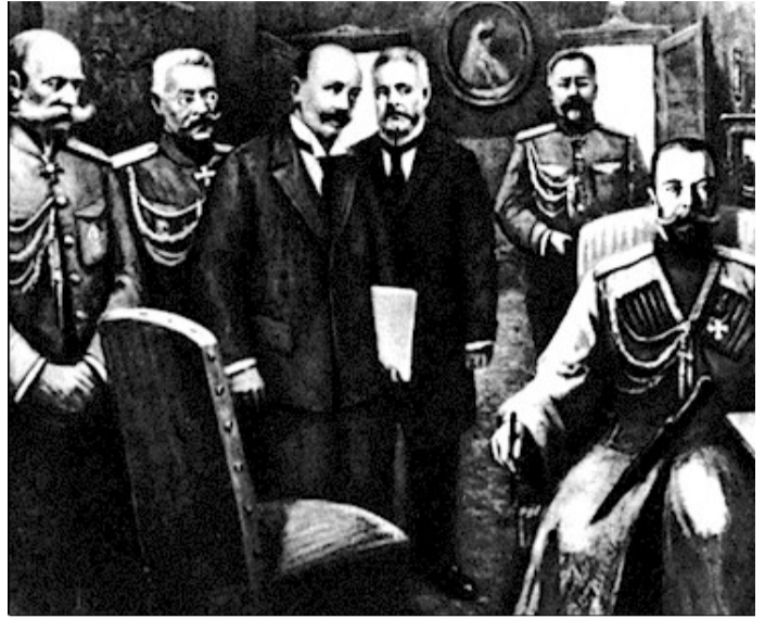
Николай II со свитой министров

И отнюдь не большевики, а эсеры и деятели буржуазных партий задерживали составы с продовольствием, идущие в Петроград и Москву, желая спровоцировать голодные бунты. Прежде всего их же усилиями расшатывалась армия. Так, обнародовав приказ № 1 Петроградского Совета, подчинявший армию Советам рабочих и солдатских депутатов, они не позаботились о мерах по поддержанию дисциплины и воинского духа. Пустили всё на самотёк, что и привело к быстрому распаду вооружённых