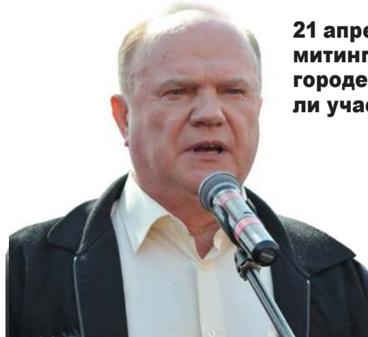
На митинге выступил председатель ЦК КПРФ Г.А. Зюганов.

«НАТО – это волк в овечьей шкуре, который прикрывается гражданской фразеологией, а на самом деле является агрессивным военным инструментом для утверждения своих позиций», - считает лидер КПРФ.