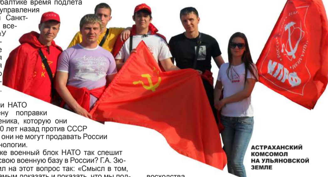
АСТРАХАНСКИЙ КОМСОМОЛ НА УЛЬЯНОВСКОЙ ЗЕМЛЕ

Этот сценарий, похоже, подходит и российскому руководству, которое из года в год делает всё более весомые уступки натовским войскам, создавая все условия для наращивания их стратегического пре-