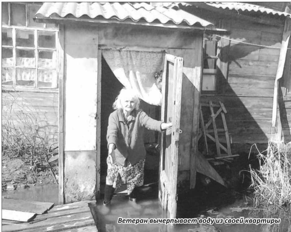
Ветеран вычерпывает воду из своей квартиры

Уважаемые земляки, чтобы представить эту гору овощей, надо указанную цифру разделить на 20 тонн (столько овощей входит, исходя из специфики груза, в один