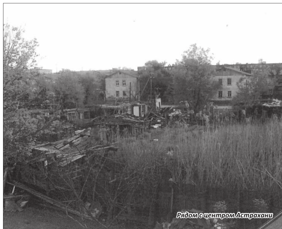
Рядом с центром Астрахани

Почему стоимость электроэнергии у нас - 2рубля 97 копеек, а в Чите и Иркутской области, где применяется коэффициент к заработной плате, соответственно 1