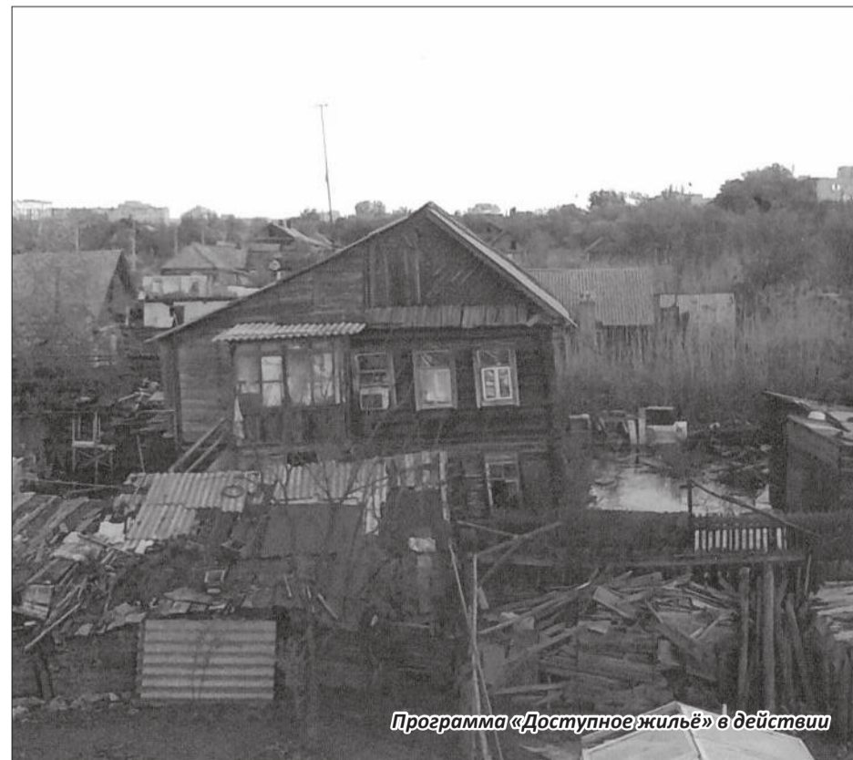
Программа «Доступное жильё» в действии

области. Через год (2006 год) мы начнем страховать через администрацию области и всех детей»