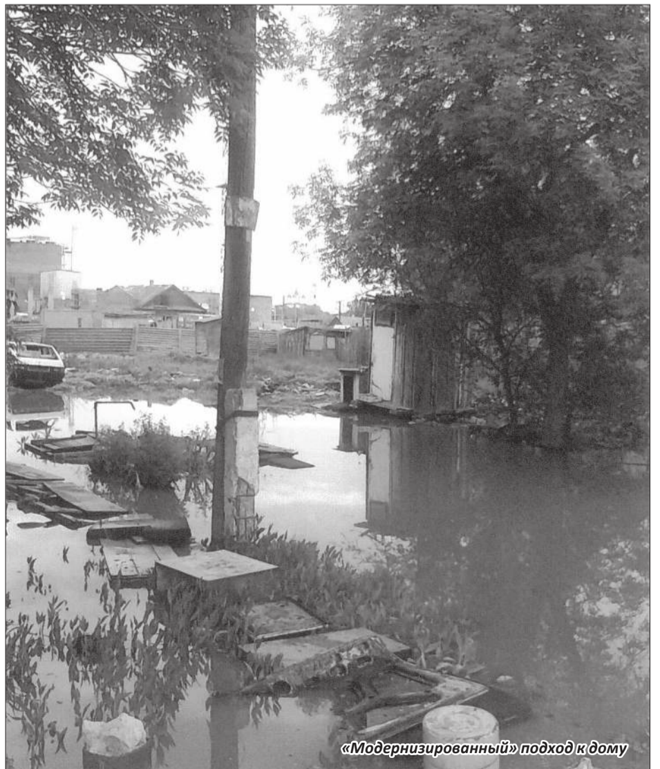
«Модернизированный» подход к дому

Где крупнейший Астраханский рыбокомбинат? Где Харабалинский консервный завод? Где механизированное сельское хозяйство? Куда делись земли сельхозугодий и средства производства сельскохозяй-