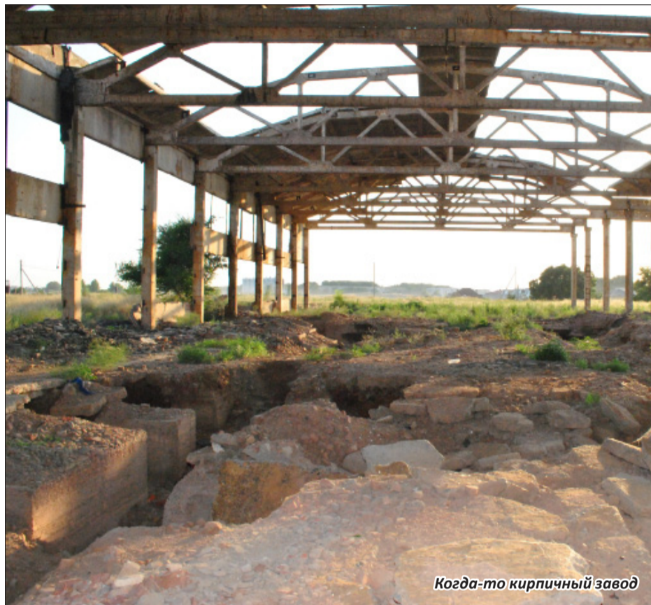
Когда-то кирпичный завод

Убежден, что если бы власть действительно была народной, в первую очередь