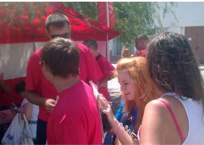
Пресс-служба Астраханского обкома КПРФ

«Молодежь за дело взялась – значит, толк будет, - сказал один из ветеранов. Очень хочется на это надеяться».