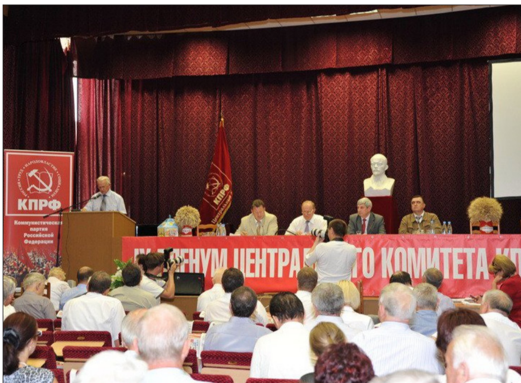
2 июля в Подмоскovie состоялся IX (июльский) совместный Пленум Центрального Комитета и Центральной Контрольно-Ревизионной Комиссии КПРФ.

По установившейся традиции начало работы Пленума сопровождалось вручением партийных билетов. Председатель Центрального Комитета Г.А. Зюганов поздравил большую группу пополнивших ряды партии и напутствовал их на активную борьбу за установление народо-властия и социализма.