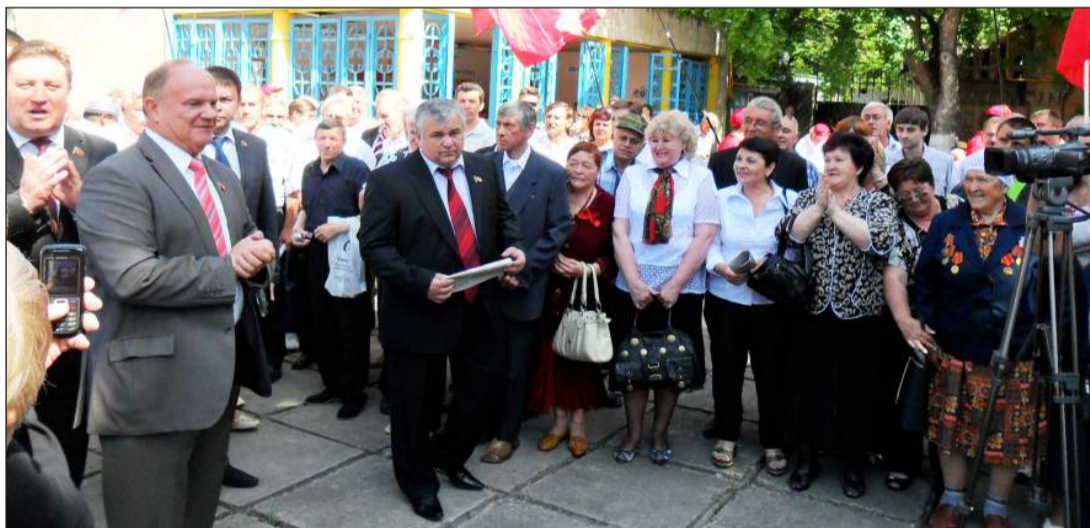
региональных отделений КПРФ».

Г.А. Зюганов рассказал о планах КПРФ в случае прихода к власти: