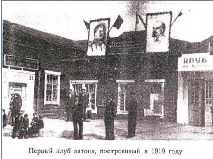
Первый клуб затона, построенный в 1919 году

Пришла первая послевоенная весна. Судоремонтный завод имени Молотова встречал ее трудовыми буднями, но с большим трудовым энтузиазмом и радостью. Много было пережито в годы Великой Отечественной войны, было много потерь, были горе и радость, было все. А сегодня Весна! Весна! Расцвет новой послевоенной жизни. Это сегодня, а все начиналось так. Волга! Свыше трех тысяч километров несет