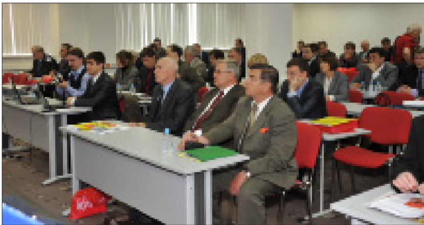
14 мая 2011 года в Москве состоялся очередной пленум Совета СКП-КПСС, на котором выступил Председатель Совета СКП-КПСС, Председатель ЦК КПРФ Г.А. Зюганов.