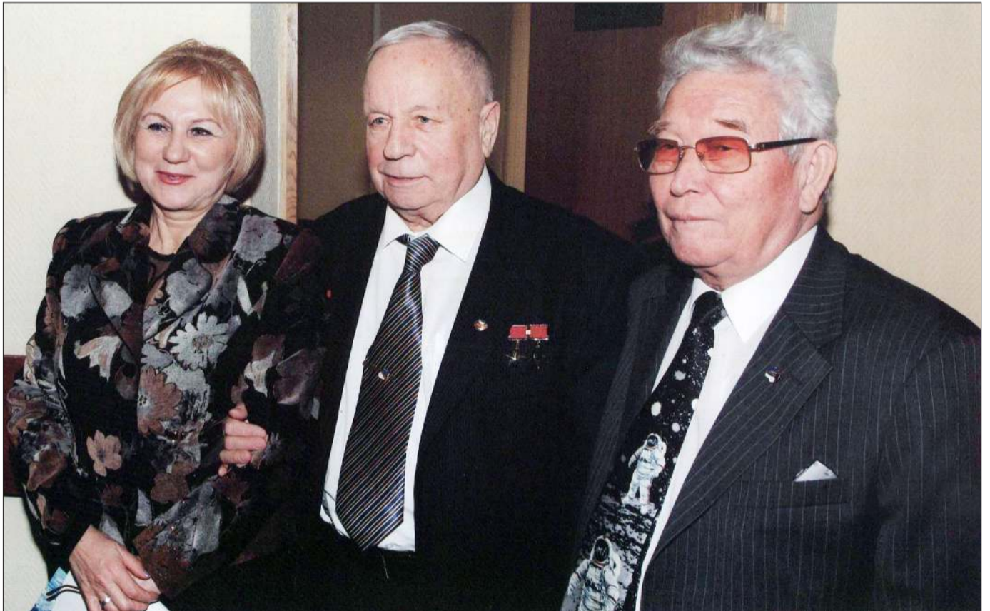
С летчиком-космонавтом СССР, дважды Героем Советского Союза В.В. Гробатко

Но вернемся к Королевским чтениям в Москве. На второй день мы все были приглашены на экскурсию в Мемориальный музей космонавтики, что находится рядом с бывшей ВДНХ. Здесь состоялась интересная встреча с кинорежиссером Василием Чигинским, который заканчи-