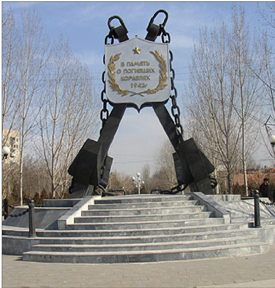
На Волгоградском рейде у острова Крит в створе Мамаева кургана установлен на мертвых якорях буй – памятник погибшим кораблям 1942-1943 годов.

В Астрахани памятник речникам, морякам Волжской Военной Флотилии установлен на Комсомольской Набережной в тени высоких тополей, которые шепотом своих листьев как бы говорят: «Спите спокойно. Вы своими жизнями отстояли независимость великой Волги – матери земли Русской».