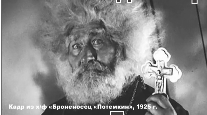
Кадр из х/ф «Броненосец «Потемкин», 1925 г.