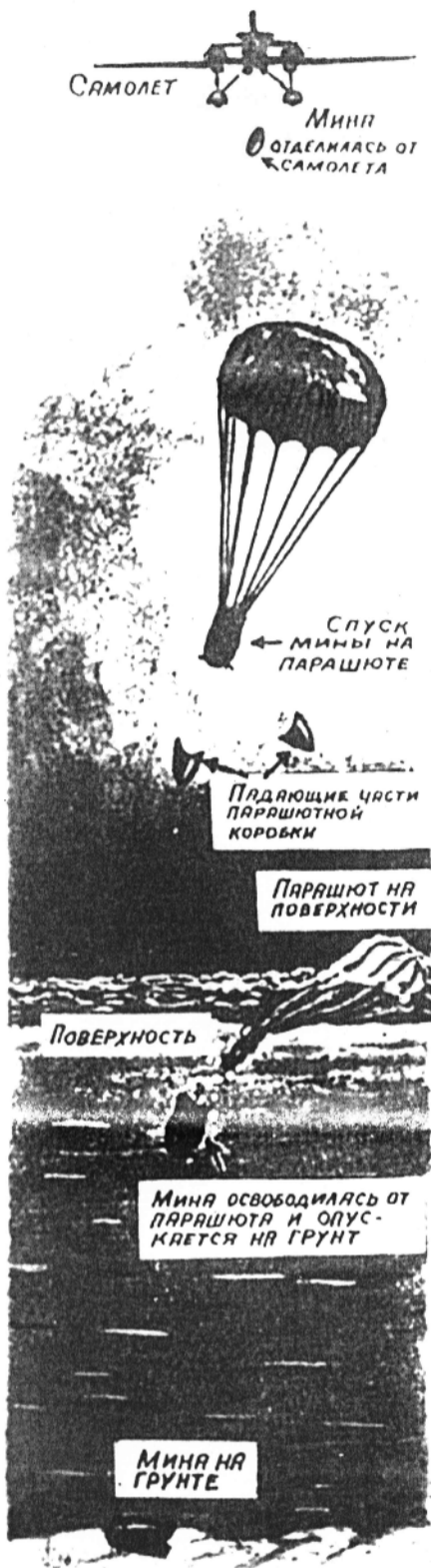
Схема постановки мин

Война, война! Великое противостояние двух враждующих сторон, двух идеологий, двух «железных мечей». Великая сила - Советский народ - это русские и белорусы, украинцы и молдаване, казахи и киргизы и многие-многие народы более чем 150 национальностей огромной страны, которая называлась Союз Советских Социалистических Республик.