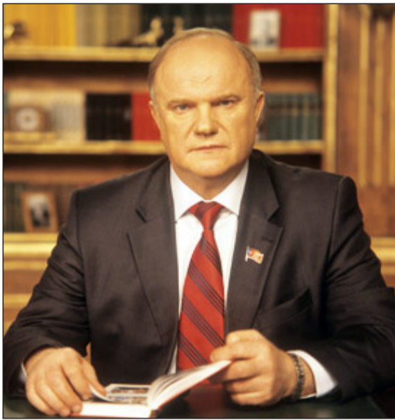
Геннадий Зюганов, Председатель ЦК КПРФ, руководитель фракции Компартии в Государственной Думе РФ: