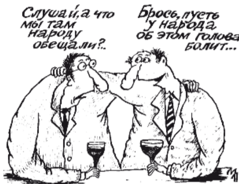
Традиционная болезнь всех политиков после выборов – тоталь-

После стольких лет демократических реформ не так-то просто заманить избирателя в свои сети. Теперь словам никто не верит. Народ говорит: «Бесполезно выбирать. Кого не выбери – все воруют. А как обещали нам жизнь райскую устроить!» Теперь нужны уже не слова, а чудеса, чтобы оказаться с депутатским мандатом или в президентском кресле. Поэтому предвыборные технологии не стоят на месте, а шагают вперед в ногу со временем – модернизируются.