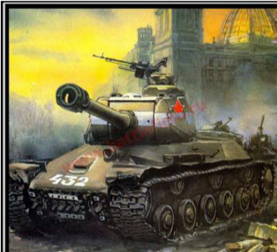
Иосиф Сталин - тяжелый танк. Оружие победы

моментом и своё же творение - загаженную ею самой социалистическую систему - она представила народу как устаревшую, неповоротливую, неподдающуюся совершенствованию экономическую модель, а форму общественной жизни - как эксперимент большевиков над народом. Разграбительку и разворовывание социалистической собственности, то есть всего того, что создавалось нашим народом с верой в будущее, власть назвала исторической закономерностью и узаконила эту «закономерность», создав себе твёрдую опору из чиновничества и ворующей крупной части криминального мира. Если перестройку и реформы в экономике и обществе можно объяснить нежеланием власти служить народу, то реформа армии выдаёт предательскую сущность власти. Ведь ни для кого не секрет, что в период глубоких преобразований в армии, страна предстаёт перед всем миром, как только что вылупившийся птенчик. Да и можно ли назвать преобразованиями сокращения армии, а её сокращают каждый год. В конце декабря ушедшего года в «Военной програм-