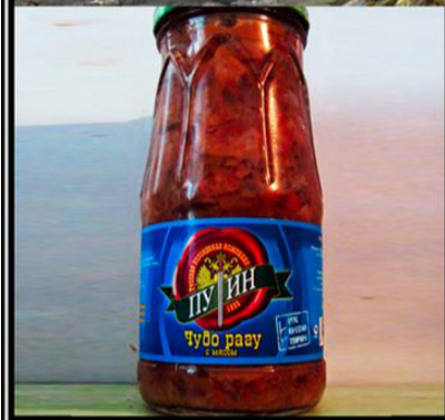
Путин - чудо рагу... с мясом