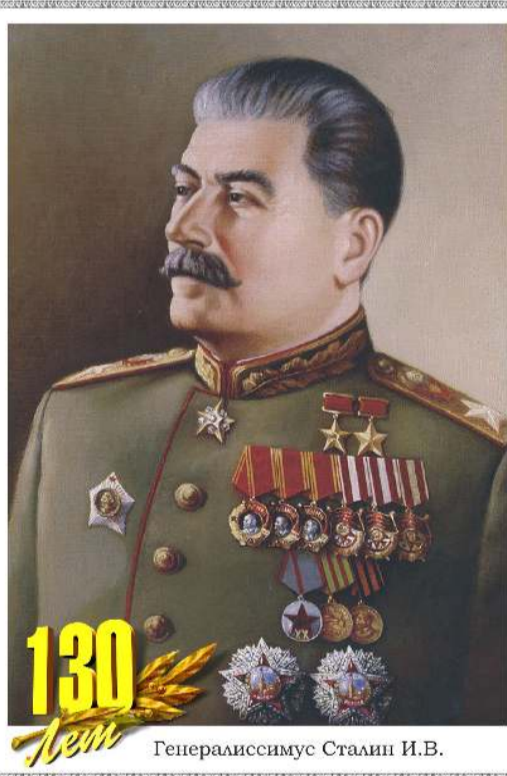
Генералиссимус Сталин И.В.

ТВ. Сегодня редкий исторический, а то и просто политический дискурс обходится без того, чтобы не было затронуто имя Сталина. И неважно, хвалебные или об-