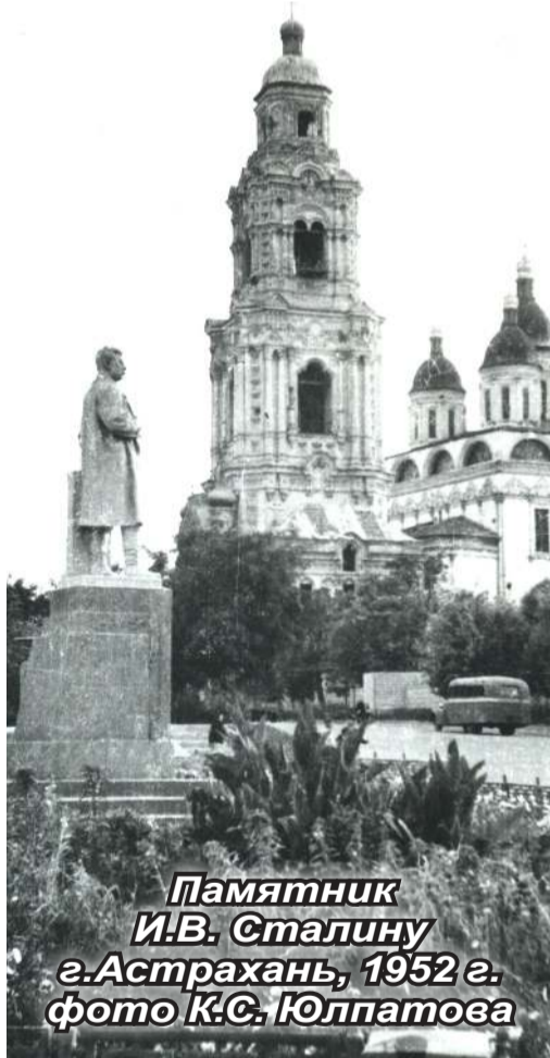
Памятник И.В. Сталину в Астрахань, 1952 г.